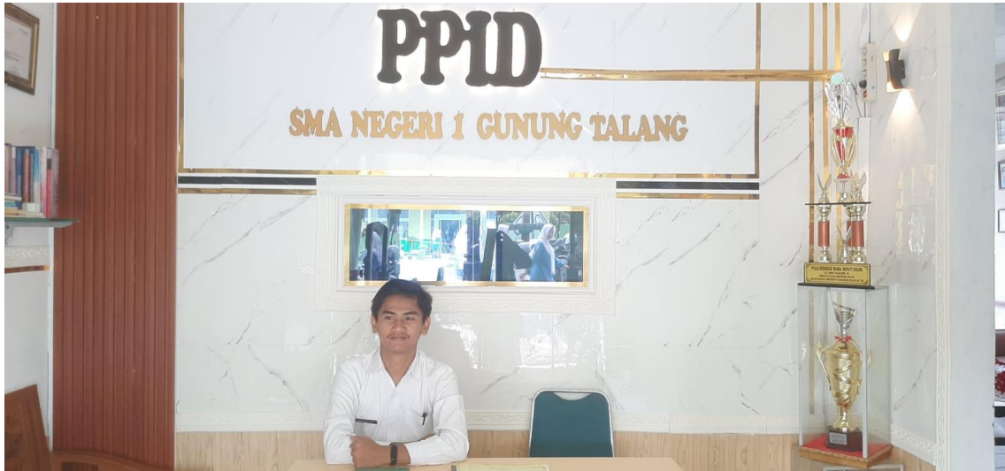
Poto Ruang PPID SMAN 1 Gunung Talang.